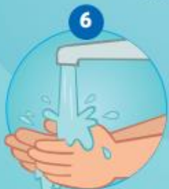
6 DE HANDEN AFSPOELEN