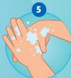
5 ... EN MET DRAAIENDE BEWEGING DE LINKER DUIM IN DE RECHTER HANDPALM WRIJVEN EN OMGEKEERD