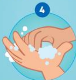
4 DE VINGERTOPPEN EN DE BEIDE ZIJDEN VAN DE HANDEN INWRIJVEN ...