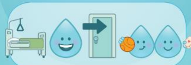
OM DEEL TE NEMEN AAN GEMEENSCHAPPELIJKE ACTIVITEITEN