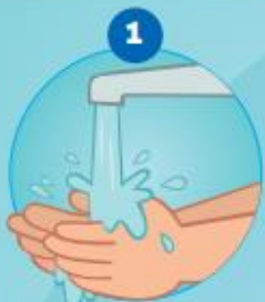
1 DE HANDEN BEVOCHTIGEN