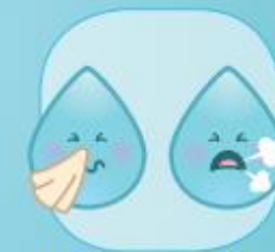
NA HET SNIJEN VAN DE NEUS, HOESTEN OF NIEZEN