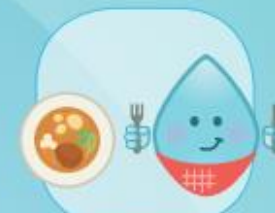
VOOR EN NA EEN MAALTIJD