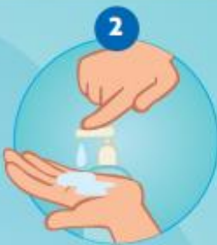
2 ZEEP NEMEN