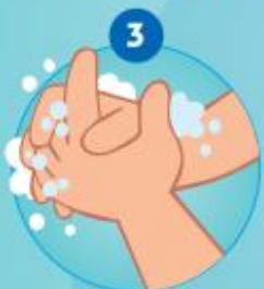
3 DE HANDEN INZEPEN