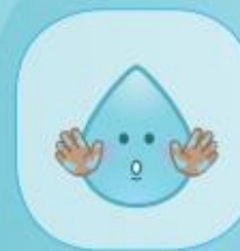
BIJ BEVULDE HANDEN