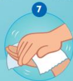
7 DE HANDEN ZORGVULDIG DROGEN